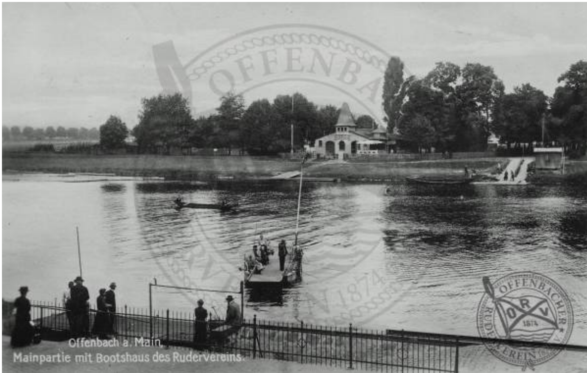
Offenbach a. Main. Mainpartie mit Bootshaus des Rudervereins.