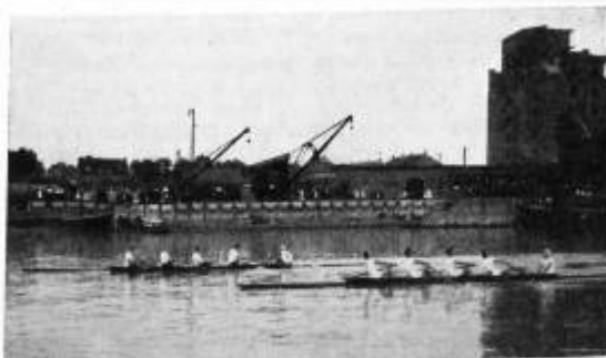
Münchener R.V. Bayern in Mannheim. Kampf im Badenia-Vierer bei 1500 m mit Offenbacher Ruder-Verein, der mit 1 m Differenz siegte.