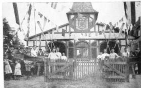
Bootstaupe beim Offenbacher R.V. von 1874.